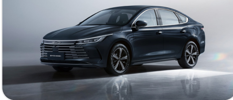
CINZA CLARO E PRETO